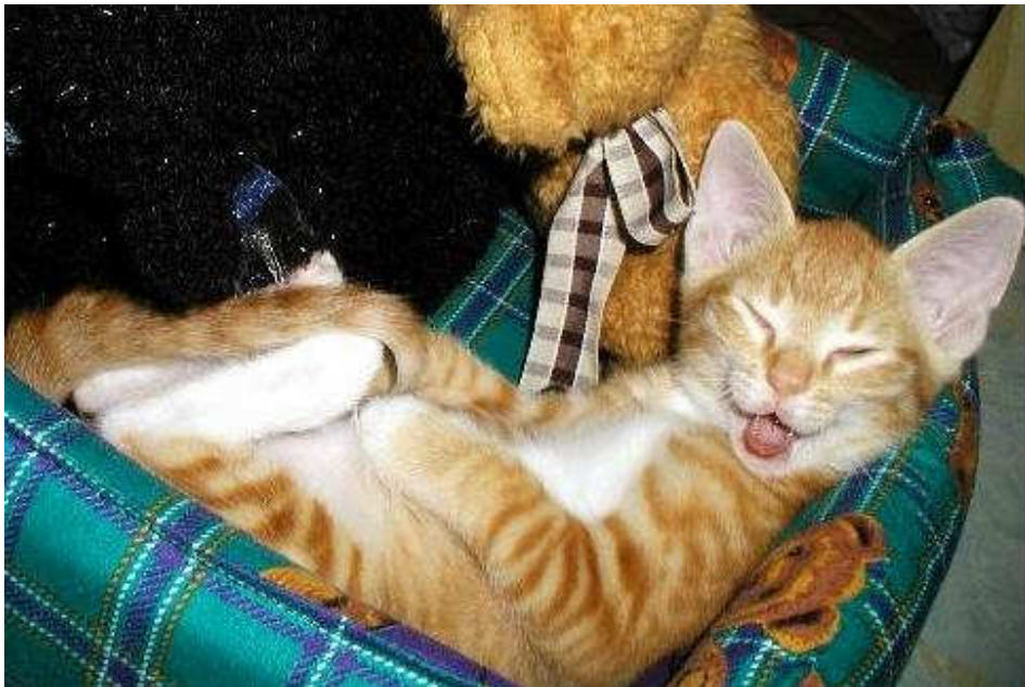
A se rouler par terre...