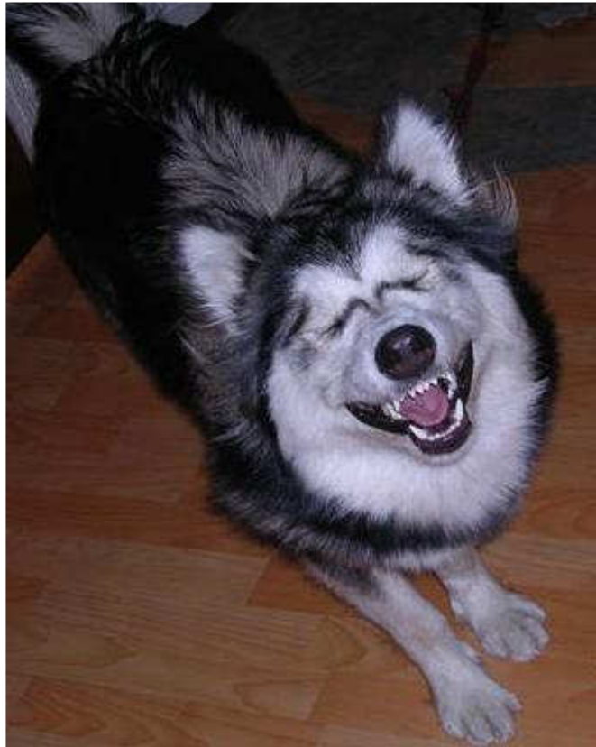
A pleines dents